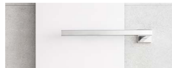
Chrómové madlo PGH1H - hranaté