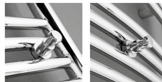
Vešiačik - Robe-Hook