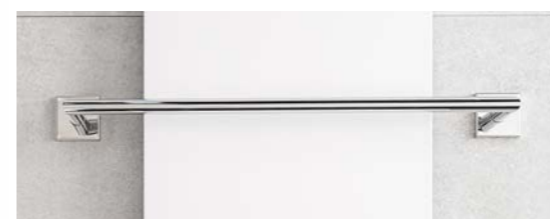
Chrómové madlo DH