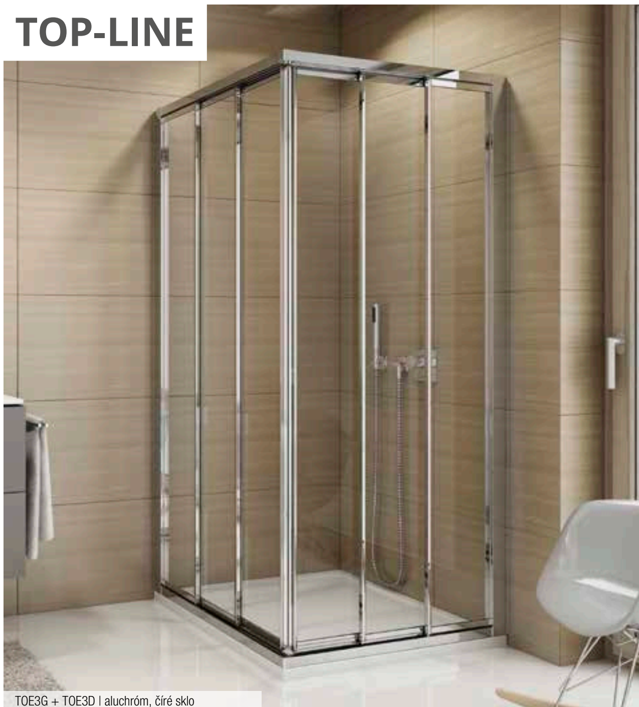
TOE3G + TOE3D | aluchróm, čiré sklo

↑ Vysvetlivky k piktogramom nájdete na vnútornej zadnej strane obálky.