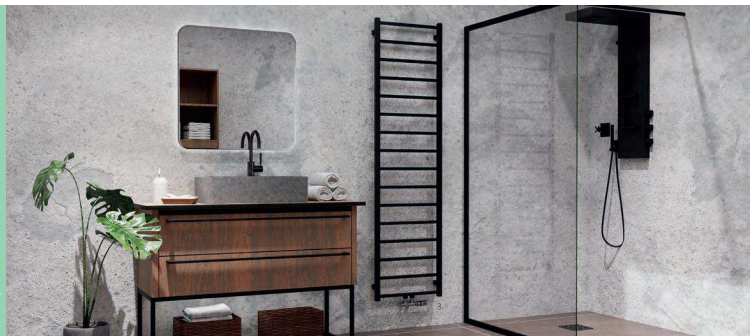
1. Fresh se středovým připojením - Růžový korál S32 [26] / 2. Fresh Chrom / 3. Fresh se středovým připojením - Černý samet S40 [51]