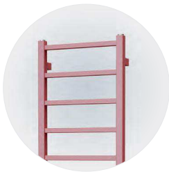
Fresh - Růžový korál S32 [26]