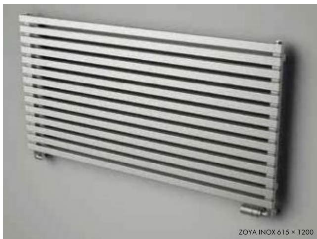
ZOYA INOX 615 × 1200