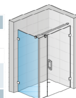
PURDT3 + PU31D