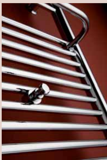
Madlo + vešiačik – vyhotovenie chróm

** Prepočet teplotných spádov na www.pmh-co.sk