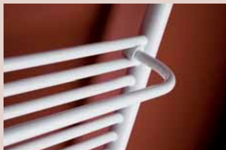
Madlo – vyhotovenie biela HTS1W

Pre modelovú radu TAIFUN boli vyrobené doplnky v podobe vešiačikov a madiel vo vyhotovení chróm a biela.