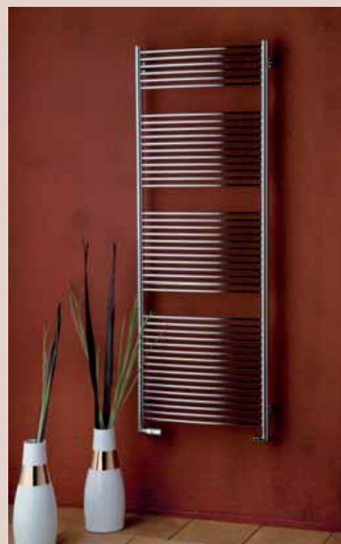
TAIFUN – vyhotovenie chróm 600 × 1630 mm – oblý