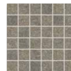
WDM05537 (SET) ○ 66 / set mat | matt

světle šedá / light grey / jasnoszara светло-серый / világosszürke / gris claro