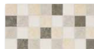
WADMB538 ○ 78 / m 2 mat | matt | V4

běžová / beige / bežowa бежевый / bézs / beige