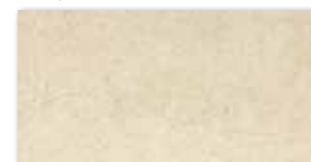
WADMB535 ○ 72 / m 2 mat | matt

bílá / white / biata / белый fehér / blanco