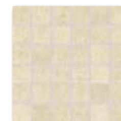
WDM05535 (SET) ○ 66 / set mat | matt

bílá / white / biata / белый fehér / blanco