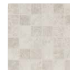
WDM05536 (SET) ○ 66 / set mat | matt

běžová / beige / bežowa бежевый / bézs / beige