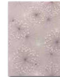
WITKB148 ○ 58 / ks lesk | glossy