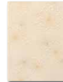
WITKB146 ○ 58 / ks lesk | glossy