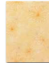
WITKB147 ○ 58 / ks lesk | glossy