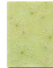
WITKB149 ○ 58 / ks lesk | glossy