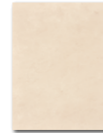
WATKB146 ○ 64 / m 2 lesk | glossy