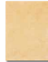
WATKB147 ○ 64 / m 2 lesk | glossy